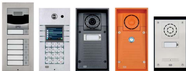
2N® EntryCom IP Verso