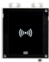
2N® ACCESS UNIT 2.0 RFID 9160334 9160334-S (Sicherung)