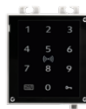
2N® ACCESS UNIT 2.0 TOUCH KEYPAD & RFID 9160336 9160336-S (Sicherung)