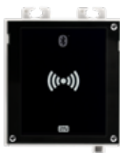
2N® ACCESS UNIT 2.0 BLUETOOTH & RFID 9160335 9160335-S (Sicherung)