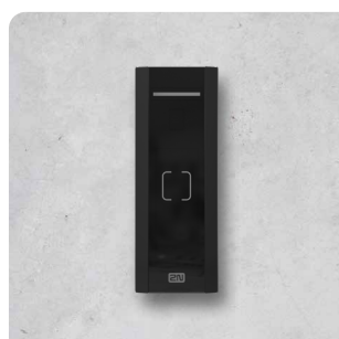
2N® ACCESS UNIT M RFID 13.56 MHZ, NFC 916112