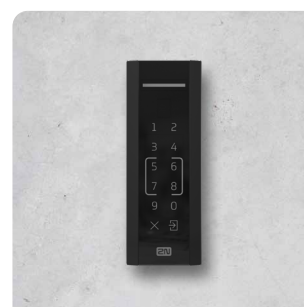
2N® ACCESS UNIT M TOUCH KEYPAD & RFID, NFC 916116