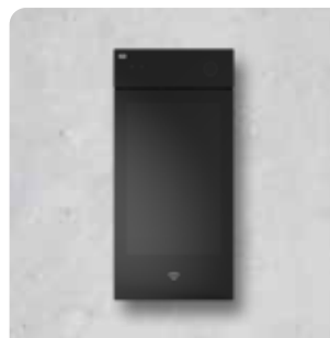
2N® IP STYLE (UNTERSTÜTZTE SECURED KARTEN) 9157101-S